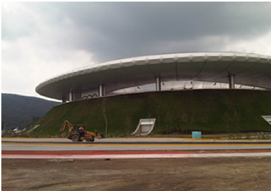
El estadio de Chivas tiene sistemas que contribuirían al cuidado del medio ambiente.